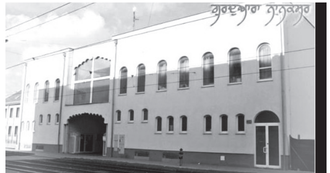
ਗੁਰਦੁਆਰਾ ਨਾਨਕਸ਼ਹ ਸਾਹਿਬ, ਗਿਲੀਸੀਯ, ਆਸਟਰੀਆ

ਸਾਢੇ ਅੱਠ ਕਰੋੜ ਆਬਾਦੀ ਵਾਲਾ ਇਹ ਦੇਸ਼ ਚਹੁੰ ਪਾਸਿਓਂ ਜ਼ਮੀਨ ਨਾਲ ਜੁੜਿਆ ਹੋਇਆ ਹੈ। ਆਪਣੀ ਪਰਬਤੀ ਸੁੰਦਰਤਾ ਲਈ ਪ੍ਰਸਿੱਧ ਆਸਟਰੀਆ ਹੈਬਸਬਰਗ ਰਾਜਵੰਸ਼ (ਜਿਨ੍ਹਾਂ ਪਹਿਲੀ ਸੰਸਾਰ ਜੰਗ ਤਕ ਹਕੂਮਤ ਕੀਤੀ) ਯੂਰਪ ਦੇ ਕੇਂਦਰ 'ਚ ਕਦੇ ਵੀ ਕਾਫ਼ੀ ਸਮੇਂ ਤਕ ਇਕ ਪ੍ਰਮੁੱਖ ਰਾਜਨੀਤਕ ਸ਼ਕਤੀ ਨਹੀਂ ਰਿਹਾ। ਫਿਰ ਵੀ ਯੂਰਪ ਦੇ ਕੇਂਦਰ ਵਿਚ ਦਨੁੱਬੇ ਟਰੇਡ ਰੂਟ ਤੇ ਹੋਣ ਨੇ ਇਸਦੇ ਸਾਮਰਿਕ ਮਹੱਤਵ ਨੂੰ ਉਜਾਗਰ ਕੀਤਾ ਹੈ। 1938-45 ਤੋਂ ਨਾਜ਼ੀ ਜਰਮਨੀ ਨਾਲ ਰਾਬਤਾ ਕਾਇਮ ਕਰਨ ਤੇ ਵਿਸ਼ਵ ਜੰਗ-2 ਤੋਂ ਬਾਅਦ ਆਸਟਰੀਆ ਤੇ ਇਤਿਹਾਦੀ ਮੁਲਕਾਂ ਦਾ